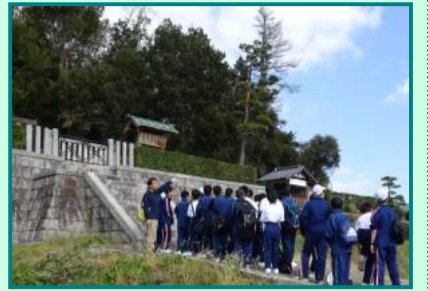
推古天皇陵にて熱心に解説を受ける

10月25日(木)本校の中学2、3年生と天王寺区にある上宮学園中学校の1年生との合同校外学習が行われた。両校の親睦を深めることはもちろん古代の史跡に囲まれた太子町において歴史を学ぶ目的で実施された。小野妹子の墓や推古天皇陵、竹ノ内街道、聖徳太子の御廟がある叡福寺などを半日かけてすべて徒歩で移動し、ポイントで社会科教員の解説を受けながら歴史見識を高めた。