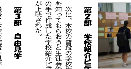
「本校の1日」を興味深く見る中学生

今年で2回目となるこの企画これまでの入試説明会とは違い、準備、当日の司会・案内から裏方まですべて生徒たちの手で運営を行った。当日は昨年度を上回る177名の方に本校を来校いただき、大盛況のうちに終了することができた。