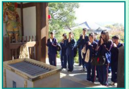
叡福寺で手を合わせる両校生徒

10月25日(木)本校の中学2、3年生と天王寺区にある上宮学園中学校の1年生との合同校外学習が行われた。両校の親睦を深めることはもちろん古代の史跡に囲まれた太子町において歴史を学ぶ目的で実施された。小野妹子の墓や推古天皇陵、竹ノ内街道、聖徳太子の御廟がある叡福寺などを半日かけてすべて徒歩で移動し、ポイントで社会科教員の解説を受けながら歴史見識を高めた。