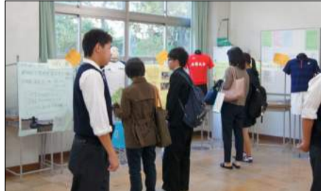
運動部の説明コーナーで案内する生徒

最後に本校の施設を見学してもらったため生徒たちが校舎内に立ち、案内や説明を行った。また、教室には運動部、文化部に分けて、ユニフォームや作品を展示しクラブの紹介を行った。来校者は真剣に見学し、ボランティアや生徒会の生徒に質問したり、雑談をしたりしながら交流が図られた。食堂では軽食との引換券がついていたこともあり、多くの人で賑わった。今回2回目の企画「UTフェ