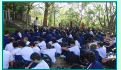
小野妹子の墓での説明