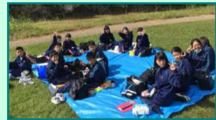
和みの広場にて仲良くお弁当