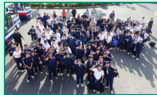
疲れも見せず最後は本校玄関にて笑顔全開

本校の中学2、3年生は学園中学の1年生をかわいいうちの先輩として仲良く話しかけ、すぐに打ち解けた様子が見られた。同じ学園での今回初めての合同校外学習、両校生徒が楽しく交流をもつことができ、本当に有意義なものになった。