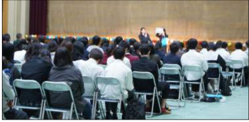
107組、177名の中学生、保護者の方が参加していただき会場は大盛況

今年で2回目となるこの企画これまでの入試説明会とは違い、準備、当日の司会・案内から裏方まですべて生徒たちの手で運営を行った。当日は昨年度を上回る177名の方に本校を来校いただき、大盛況のうちに終了することができた。