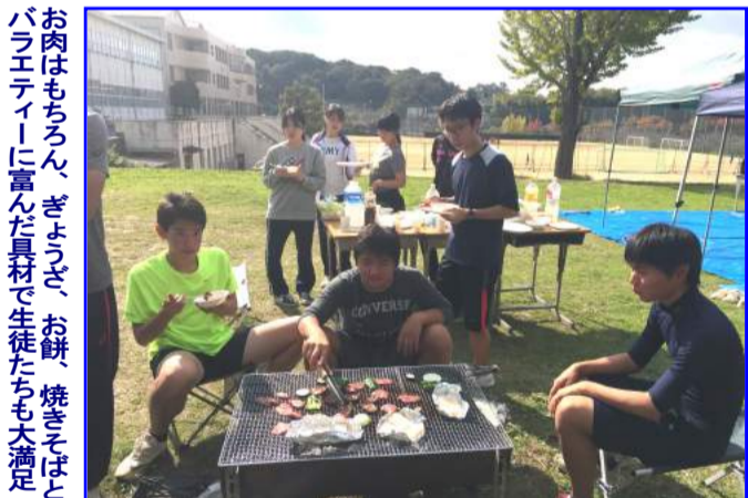
お肉はもちろん、ぎょうざ、お餅、焼きそばとバラエティーに富んだ具材で生徒たちも大満足