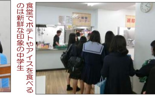
食堂でホットトやアイスを食べるのは新鮮な印象の中学生

第二部 学校紹介ビデオ 次に、本校の普段の学校生活を知ってもらおうと生徒会役員の手で作成した学校紹介ビデオが上映された。