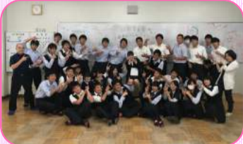
6月の教育実習生時 (高校2年4組の生徒と...)