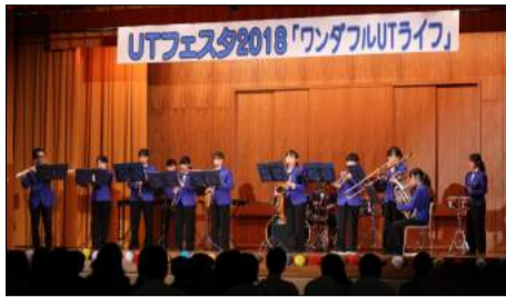
吹奏楽部の迫力ある演奏でお出迎え

学校新聞 平成30年度 『上宮太子ニュース』 11, 12月号 発行：上宮太子 中学高等学校