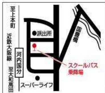
『国分線』 近鉄大阪線「河内国分」駅東口 (JR高井田駅から徒歩5分)より約20分